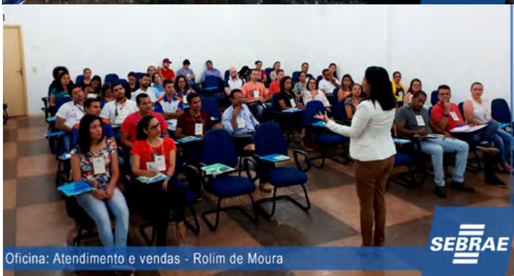
Oficina: Atendimento e vendas - Rolim de Moura