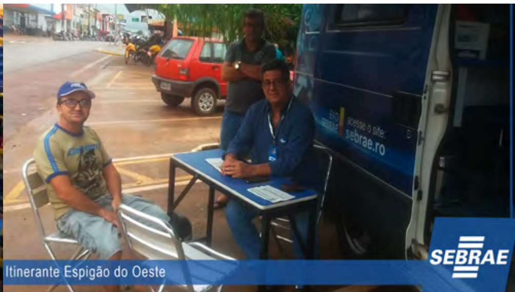
Itinerante Espigão do Oeste