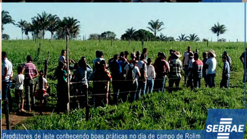
Produtores de leite conhecendo boas práticas no dia de campo de Rolim