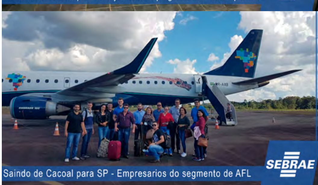
Saindo de Cacoal para SP - Empresarios do segmento de AFL