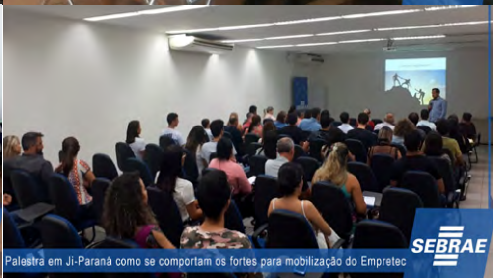
Palestra em Ji-Paraná como se comportam os fortes para mobilização do Empretec