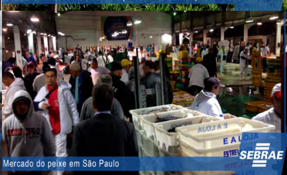
Mercado do peixe em São Paulo