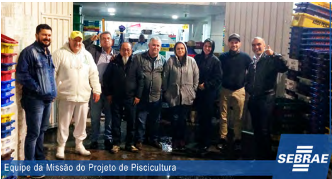
Equipe da Missão do Projeto de Piscicultura