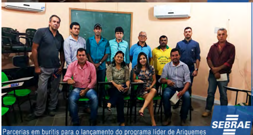
Parcerias em buritis para o lançamento do programa líder de Ariquemes